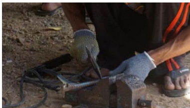
Gambar 15. Perbaikan/pembuatan tiang lampu