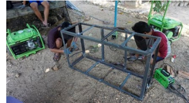
Gambar 9. Pelaksanaan kegiatan pelatihan tahap 9.

Pelatihan tahap 8 : pendampingan dan pembuatan proyek pengelasan (alat angkut alat las dan genset). Kegiatan pelatihan terlihat pada gambar 9