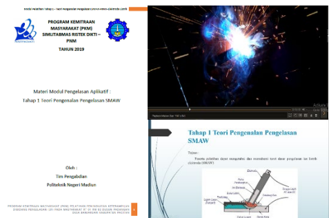
Gambar 10. Modul dan video tutorial

Dan semua tahapan meliterasi dari modul praktek [6]. Kegiatan seluruh tahapan sesuai dengan modul pelatihan dan video tutorial (link youtube : https://youtu.be/UB6sg4fDMDA ), terlihat tampilan modul dan video tutorial pada gambar 10.