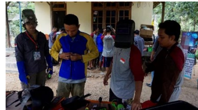
Gambar 3. Pelaksanaan kegiatan pelatihan tahap 2.

Pelatihan tahap 2 : Prosedur pengelasan (Materi teori Keselamatan Kesehatan Kerja, serta pre-test dan post test evaluasi. Kegiatan pelatihan terlihat pada gambar 3