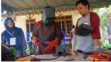
Gambar 6. Pelaksanaan kegiatan pelatihan tahap 5.

Pelatihan tahap 5 : Materi prosedur pengelasan dasar (teori dan praktek pengelasan 2F, dan proyek sambungan pengelasan, evaluasi unjuk kerja). Kegiatan pelatihan terlihat pada gambar 6