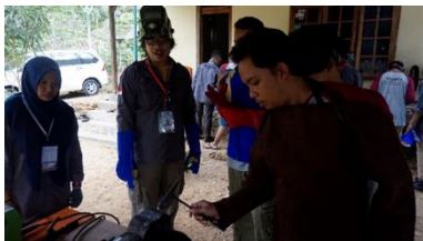
Gambar 7. Pelaksanaan kegiatan pelatihan tahap 7.

Pelatihan tahap 6 : Materi prosedur pengelasan dasar (teori dan praktek pengelasan 3F, dan proyek sambungan pengelasan, evaluasi unjuk kerja). Kegiatan pelatihan terlihat pada gambar 7