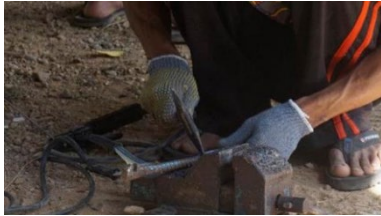
Gambar 12. Hasil perbaikan alat pertanian (cangkul) dari pengelasan

Tolak ukur keberhasilan terlihat dari efektifitas peserta menggunakan peralatan pengelasan yang telah dihibahkan, seperti peserta memanfaatkan alat alat dan melakukan metode pengelasan pada bidang perbaikan perkakas atau alat pertanian, terlihat pada gambar 12.