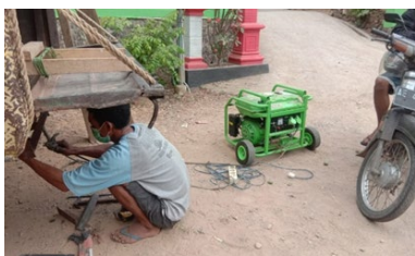
Gambar 14. Perbaikan kendaraan truk