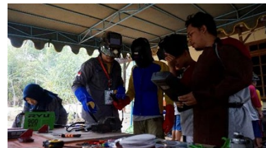
Gambar 5. Pelaksanaan kegiatan pelatihan tahap 4.

Pelatihan tahap 4 : Materi prosedur pengelasan dasar (teori dan praktek pengelasan 1F, dan proyek sambungan pengelasan, evaluasi unjuk kerja). Kegiatan pelatihan terlihat pada gambar 5