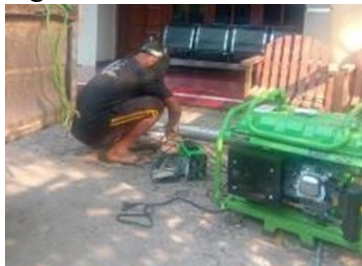
Gambar 13. Perbaikan alat pertukangan (plaser) dari pengelasan

Dan untuk kebutuhan perbaikan lain, telah dilakukan perbaikan dengan metode pengelasan pada perbaikan alat pertukangan, perbaikan kendaraan dan pembuatan tiang lampu, seperti terlihat pada gambar 13,14, dan 15.