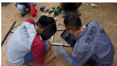
Gambar 8. Pelaksanaan kegiatan pelatihan tahap 8.

Pelatihan tahap 7 : pendampingan dan pembuatan proyek pengelasan (tangga lipat besi) evaluasi berupa unjuk kerja). Kegiatan pelatihan terlihat pada gambar 8