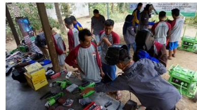
Gambar 4. Pelaksanaan kegiatan pelatihan tahap 3.

Pelatihan tahap 3 : Prosedur pengelasan (Materi teori pengelasan, Keselamatan Kesehatan Kerja, pengenalan perlengkapan pengelasan dan instalasi, serta pre-test dan post test evaluasi. Kegiatan pelatihan terlihat pada gambar 4