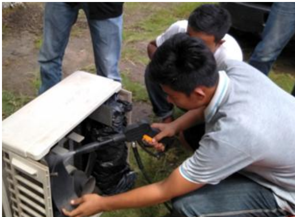
Gambar 5. Proses pencucian bagian luar AC