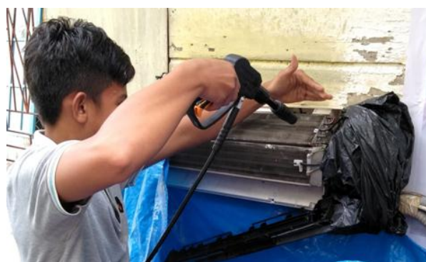
Gambar 4. Proses pencucian bagian dalam AC

Gambar 2 memperlihatkan proses pelatihan yang dimulai dari Opening dan Introduction dengan peserta pelatihan mengenai hal-hal yang berkaitan dengan kegiatan pelatihan. Selanjutnya adalah gambar 3 pelaksanaan pelatihan dimulai dari pembekalan secara teoritis materi perawatan AC.