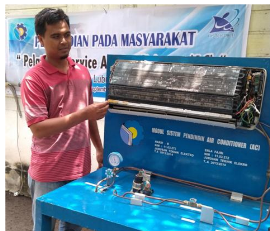
Gambar 3. Penyampaian materi

Gambar 2 memperlihatkan proses pelatihan yang dimulai dari Opening dan Introduction dengan peserta pelatihan mengenai hal-hal yang berkaitan dengan kegiatan pelatihan. Selanjutnya adalah gambar 3 pelaksanaan pelatihan dimulai dari pembekalan secara teoritis materi perawatan AC.