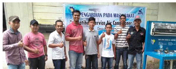
Gambar 2. Acara Opening and Introduction

Kegiatan Pelatihan Perawatan Air Conditioning (AC) ini telah dilaksanakan dari tanggal 8 sampai dengan 9 September 2018. Pelatihan ini diikuti sebanyak 6 peserta. Pelatihan Pengabdian Pelatihan Perawatan Air Conditioning (AC) ini terdiri dari dua tahap yaitu tahap penyampaian/pembekalan materi dan tahap studi kasus dilapangan. Materi yang disampaikan seperti materi - materi penunjang praktik seperti pengenalan komponen & cara kerja AC, pengenalan alat kerja perawatan dan instalasi AC, dasar teknik instalasi AC, prosedur dasar bongkar-pasang AC dan prosedur perawatan (cuci) AC.