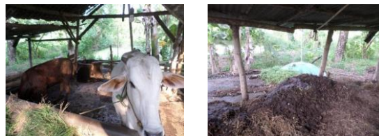
Gambar 1. Limbah ternak sapi

bakar. Sementara itu pemanas sebaiknya dinyalakan sekitar 4-5 jam dalam satu hari, sebelum DOC datang. Sehingga suhu dalam ruangan bisa lebih hangat dahulu. Pemanas harus sudah dipasang 2- 3 hari sebelum DOC datang [5]. Pemanas diturunkan berangsur-angsur dari 32 °C, setiap empat hari sekali sebanyak 1°C. Untuk ayam jowo super lama biasanya penggunaan pemanas selama 12 – 14 hari, tergantung cuaca dan iklim [5]. Penggunaan pemanas selama itu menyebabkan biaya produksi ayam saat fase brooding sedikit bertambah untuk membeli tabung gas LPG. Biogas merupakan bahan bakar alternative pengganti LPG yang salah satu pembuatannya dari limbah kotoran sapi[8]. Kotoran sapi ini banyak yang menumpuk dan belum dimanfaatkan secara maksimal oleh peternak.