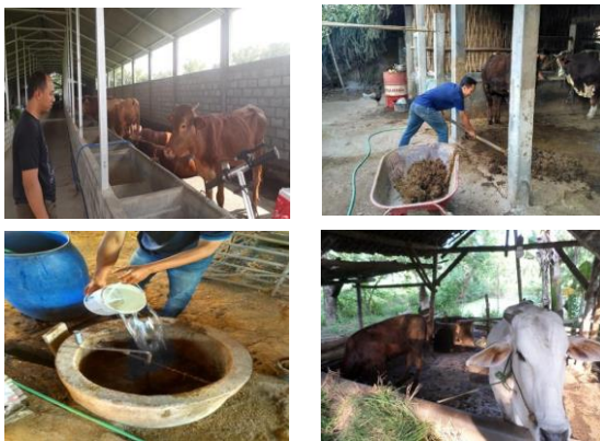
Gambar 2. Proses pembuatan biogas

harga jual kotoran sapi. Belum banyak yang mengetahui pemanfaatan kotoran sapi untuk biogas. Apabila 1 ekor sapi/kerbau bisa menghasilkan kurang lebih 2 m 3 biogas/hari, maka 1 m 3 biogas bisa dipakai setara dengan 0,62 liter minyak tanah. Selain itu, limbah dari biogas dapat dimanfaatkan sebagai pupuk organik untuk pertanian. Biogas merupakan bahan bakar gas yang diperoleh dari hasil fermentasi limbah organik baik dari hewan, pertanian, domestic dan industri secara anaerobic. Biogas terdiri dari metane, karbon dioksida, nitrogen, oksigen dan hydrogen sulfide. Limbah organik yang banyak mengandung gas metane salah satunya adalah kotoran sapi yang bisa ditemukan dengan mudah di daerah peternakan sapi baik skala besar maupun skala kecil.