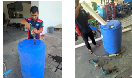
Gambar 5. Proses fabrikasi digester

Proses fabrikasi dan ujicoba digester dan saluran biogas ditunjukkan seperti pada gambar berikut: