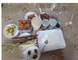
Gambar.5 bahan dasar produk

Bahan dasar pembuatan produk tersebut yakni jahe, kencur, beras putih, asam jawa, gula merah, kapulogo, dan serai. Bahan-bahan tersebut sebelum diolah akan dipilih terlebih dahulu untuk kelayakan produksinya. Setelah dipilih, bahan tersebut dicuci hingga bersih dan siap untuk diproduksi.