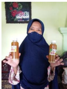
Gambar.3 Mitra Desa Ranuklindungan

Produk minuman jamu beras kencur ini merupakan produk rumahan yang diolah sendiri oleh sang pemilik. Mulai dari bahan dasar, pembuatan, hingga packaging dan pemasarannya. Minuman jamu beras kencur ini merupakan minuman segar yang pembuatannya tidak menggunakan bahan pengawet. Selama pengabdian di Desa Ranuklindungan ini khususnya di mitra, banyak pembelajaran yang diambil dalam kegiatan tersebut.